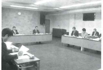
10月21日、決算特別委員会視察 視察先 山口県事務所(山口市)

父を思うと、父の笑顔が浮かんでくる。山口の我が家に来て三年、昨秋、父はにわか旅立って逝った。「同じ日本ではなにか」と言っていて、本籍、墓地を山口にすることを認められた父。陸士卒の職業軍人であったが、平和の大切さを誰よりも感じていた父。母が逝った年の暮、父は山口に来た。以来、父妻娘私の四人の生活が始まった。