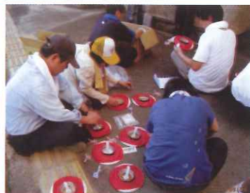
8月6日 山口七夕提灯祭りに参加のスペシャルオリンピックス山口の方とローソクセット