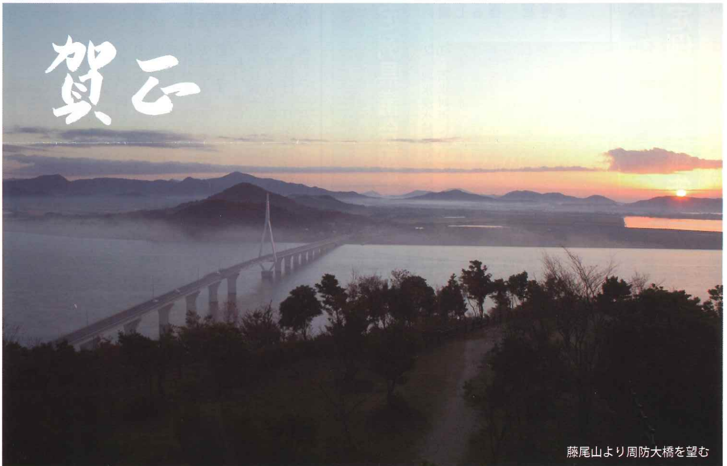
藤尾山より周防大橋を望む

山口市赤妻町3丁目3番20号信和ビル2F TEL (083)921-5455 FAX(083)921-5411