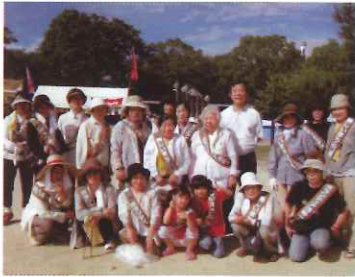
8月7日 山口パークロード周辺清掃活動に参加の「あいあいクラブ」会員と白一点の合志県議