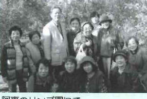
阿東のリンゴ園にて