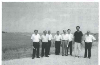
8月3日、農林水産委員会の(有)正八視察(秋田県大瀧村)