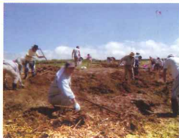
7月19日 第9回千鳥ヶ浜(阿知須)清掃活動連続3回参加