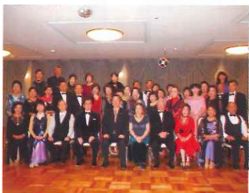
12月18日 寶尚会長として「山口社交ダンスクラブ発表会とダンスパーティ」に参加 於 ホテル松政