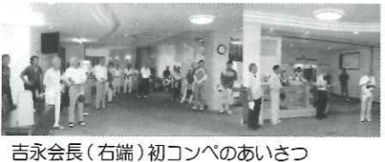
吉永会長(右端)初コンペのあいさつ