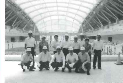
9月1日、やまぐちスポーツ文化育成対策委員会の山口きらら博記念公園水泳プール視察(工事中)