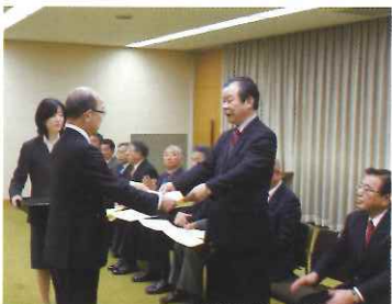
11月17日 県議在職15年自治功勞者知事表彰