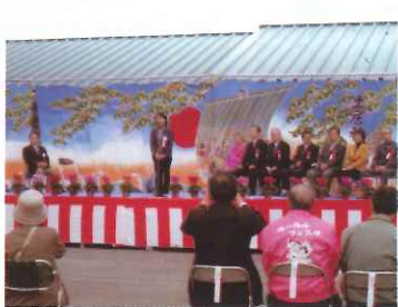
11月13日 ルーラル315・367フェスターオープンセレモニーの出席 会場は阿東町嘉年「かあちゃんのふれあい広場」