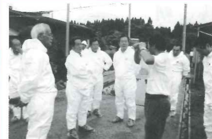
8月2日、農林水産委員会の秋田県・比内地鶏視察