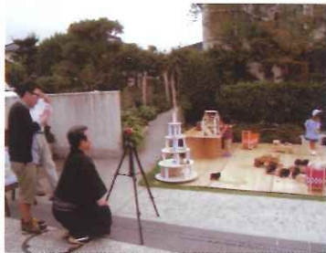
10月2日 第15回アートフル山口に和服姿で盛り上げる