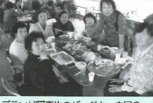
ブランド阿東牛のパーベキュー昼食

ここでも堪能しました。ここからバスは復路となり、途中、徳佐駅に寄り、ポランテア駅員さんから、合併阿東の話聞き勉強しました。