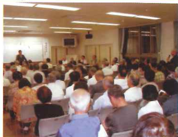
7月17日 県政報告会を吉敷地域交流センターにて開催 地元の方に熱く報告、多岐の質疑があった